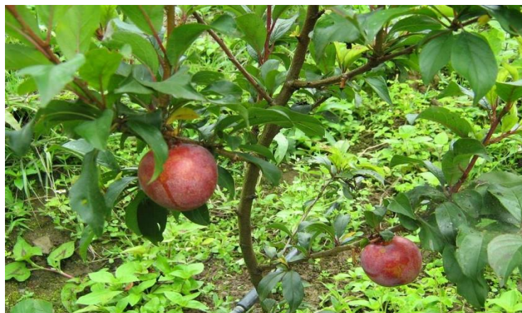
Fig 2. Duraznos dando fruto

Sistema de riego por goteo con una línea de goteo de 16 mm con goteros Turboline de 2 litros/hora espaciados a 50 cm.