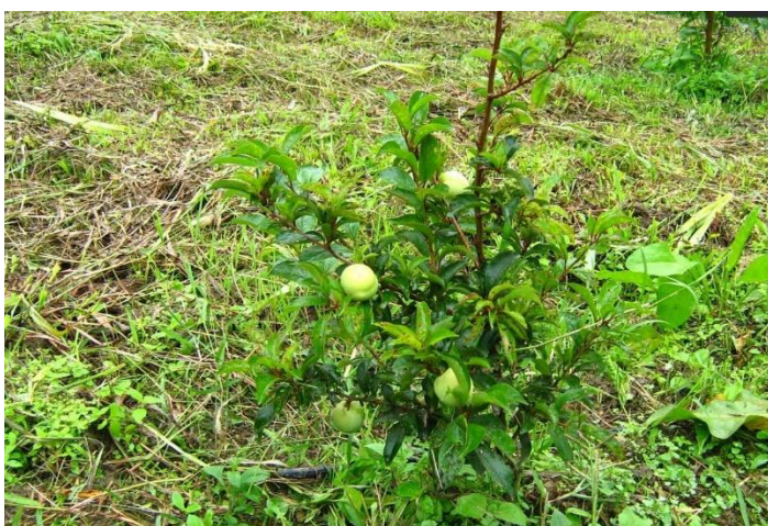
Fig 3. Producción precoz